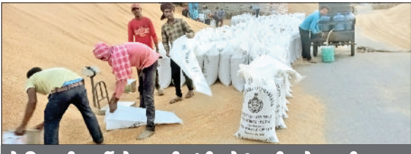
दो दिन की गर्मी से चणकी मंडी, गेहूं खरीदने पर पकड़ी रफ्तार